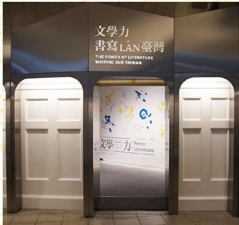
臺灣文學館常設展 「文學力—書寫LÁN臺灣」